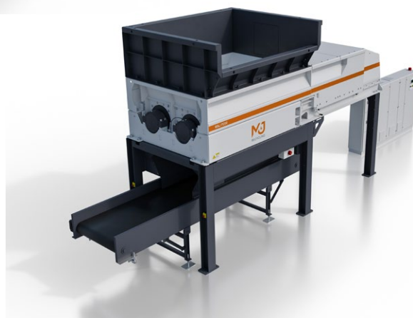
Version mit elektrischem Antrieb