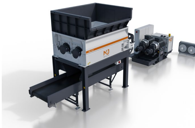
Version mit hydraulischem Antrieb