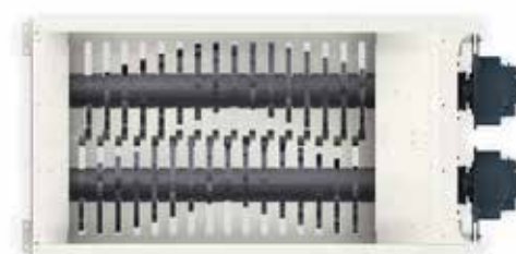
Table de coupe 16 couteaux