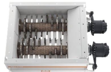
Schneidisch 8 Messer