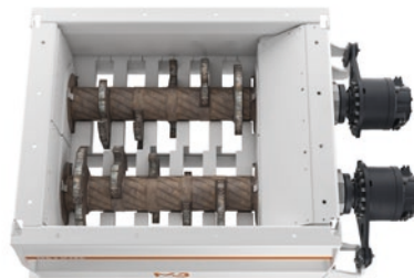
Schneidisch 5 Messer